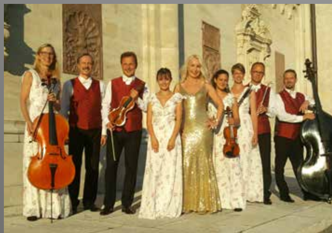
WIENER SALON VIRTUOSEN