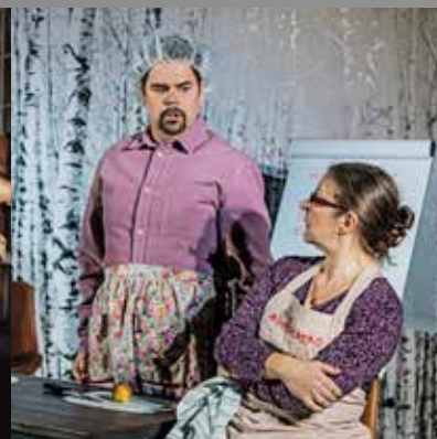
Finska för invandrare