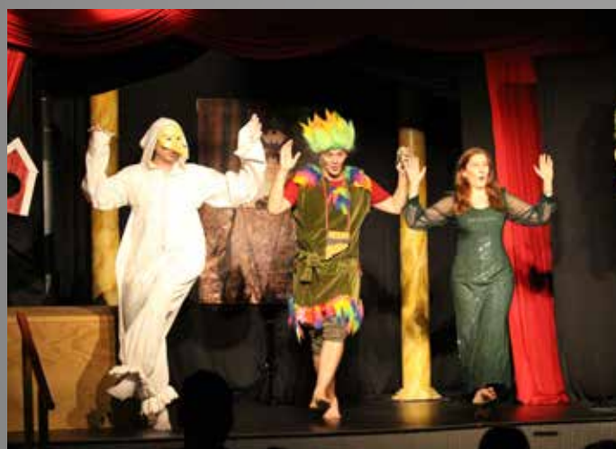
TROLLFLÖJTEN - MINOPERA

Vi sökte repertoar och publikutvecklingsstöd ifrån Riksteatern för att kunna genomföra ett operaprojekt 2022. Syftet med projektet var att vi ville bredda föreningarnas repertoar samt att de föreningsaktiva skulle öka sina kunskaper kring opera och operaarrangemang. Projektet gjordes i samarbete med Musik i Syd och operakonsulenten Iréne Kleven. Vi kunde med hjälp av stödet subventionera utvalda operaproduktioner som var mindre och mer lättarrangerade för föreningarna. De fick också hjälp med marknadsföring av Musik i Syd. Flertalet av föreningarna köpte in och arrangerade en operaföreställning under hösten 2022. Arrangemangen var välbesökta och uppskattade av så väl publik som arrangörer.