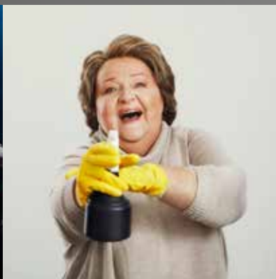
Britt-Marie var här