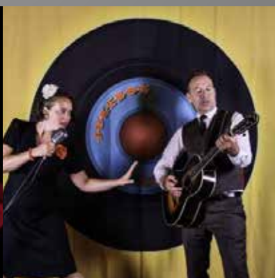
Jukebox! Rock n 'Roll