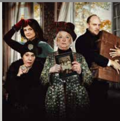
Tre lite äldre systrar