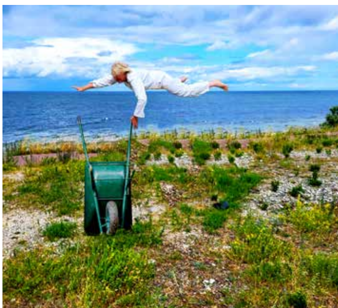
Verksamhetsledaren övar cirkustrick...