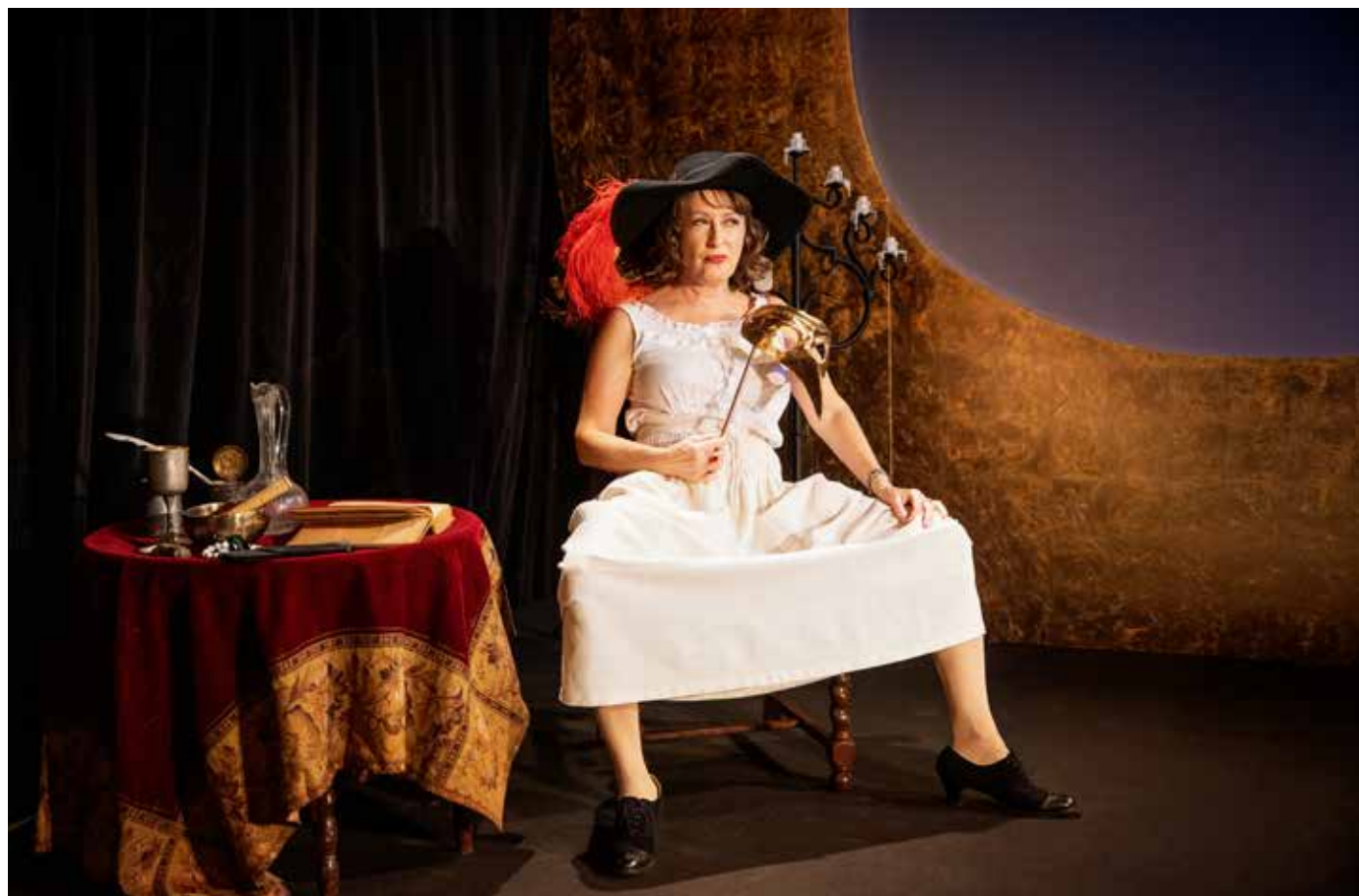
Bild från föreställningen "Är det hett här?"