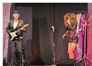
Tina – Simply the best

Årets verksamhet har varit mycket stor med många olika arrangemang.