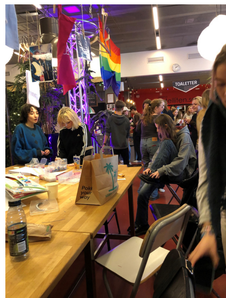
Deltagare på LÄNK, Arena Satelliten i Sollentuna

Tillsammans med Region Uppsala (Riksteatern Uppsala) och Satelliten i Sollentuna arrangerades den första av två regionala länkfestivaler i länet, den ägde rum 11 - 12/3, sex föreställningar spelades under tre ensemblerna kom från Viktor Rydbergs Gymnasium, Uppsala Kulturskola, Knivsta Kulturskola, Kungsholmens Gymnasium med föreställningarna "Manhattanprojektet", "Hunk", och "Neo". Den andra LÄNK festivalen ägde rum på Riksteatern i Hallunda under en dag, 2/4 med 4 ensembler från Fryshuset gymnasium och Kulturskolan i Stockholm som spelade, "Manhattanprojektet", "Hunk" och "Att dela en kaka".