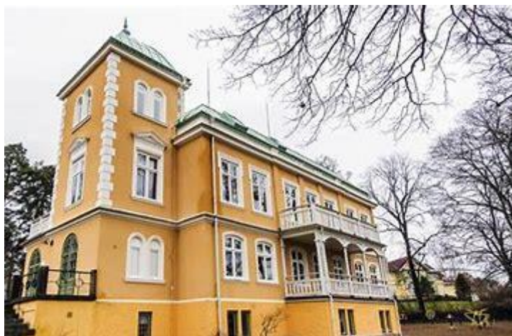
Slottet i Forshaga