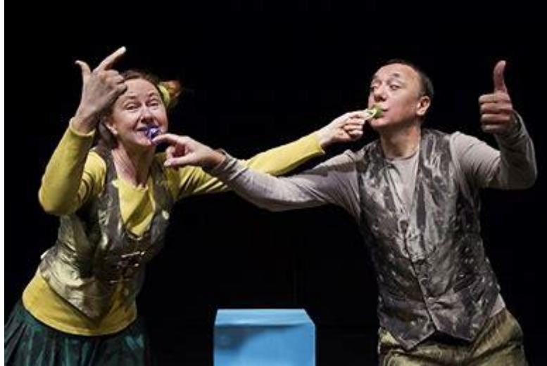
Figurteaterkompaniet från Filipstad