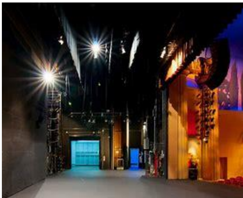
Backstage Riksteatern Hallunda