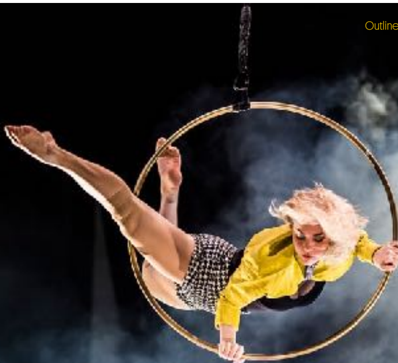
Outlines, Face First, Arr Umeå Teaterförening

Riksteatern Norra interregionala projekt föreslås i olika delar starta våren 2022.