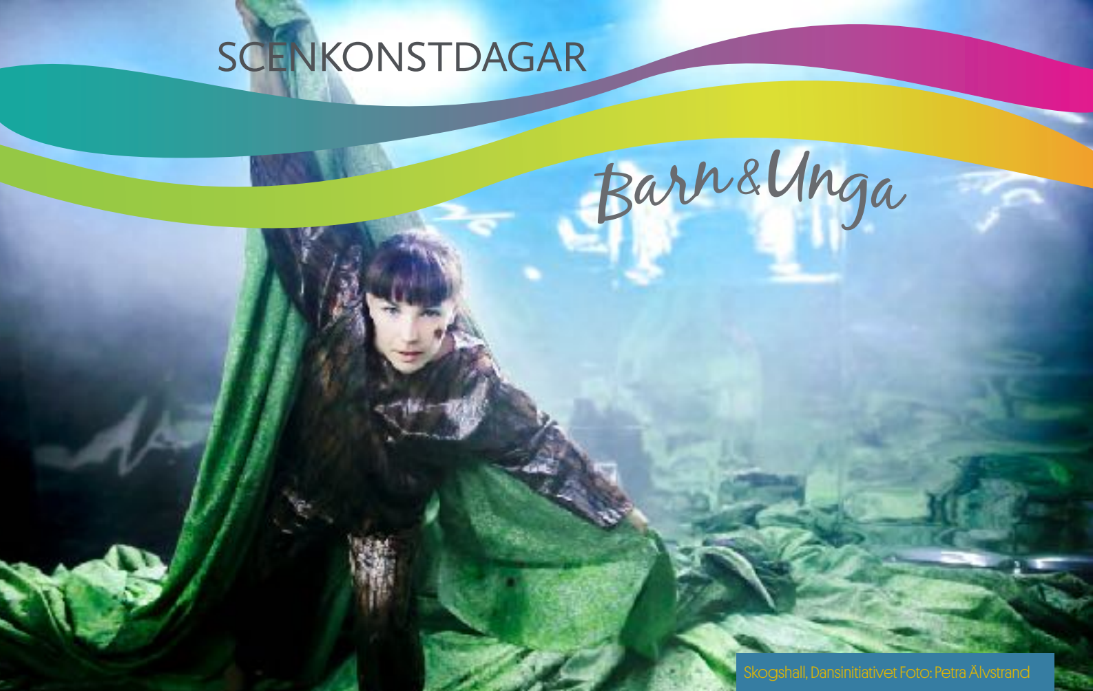
Skogshall, Dansinitiativet