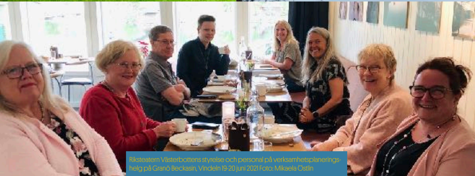
Riksteatern Västerbottens styrelse och personal på verksamhetsplaneringshelg på Granö Beckasin, Vindelån 19-20 juni 2021