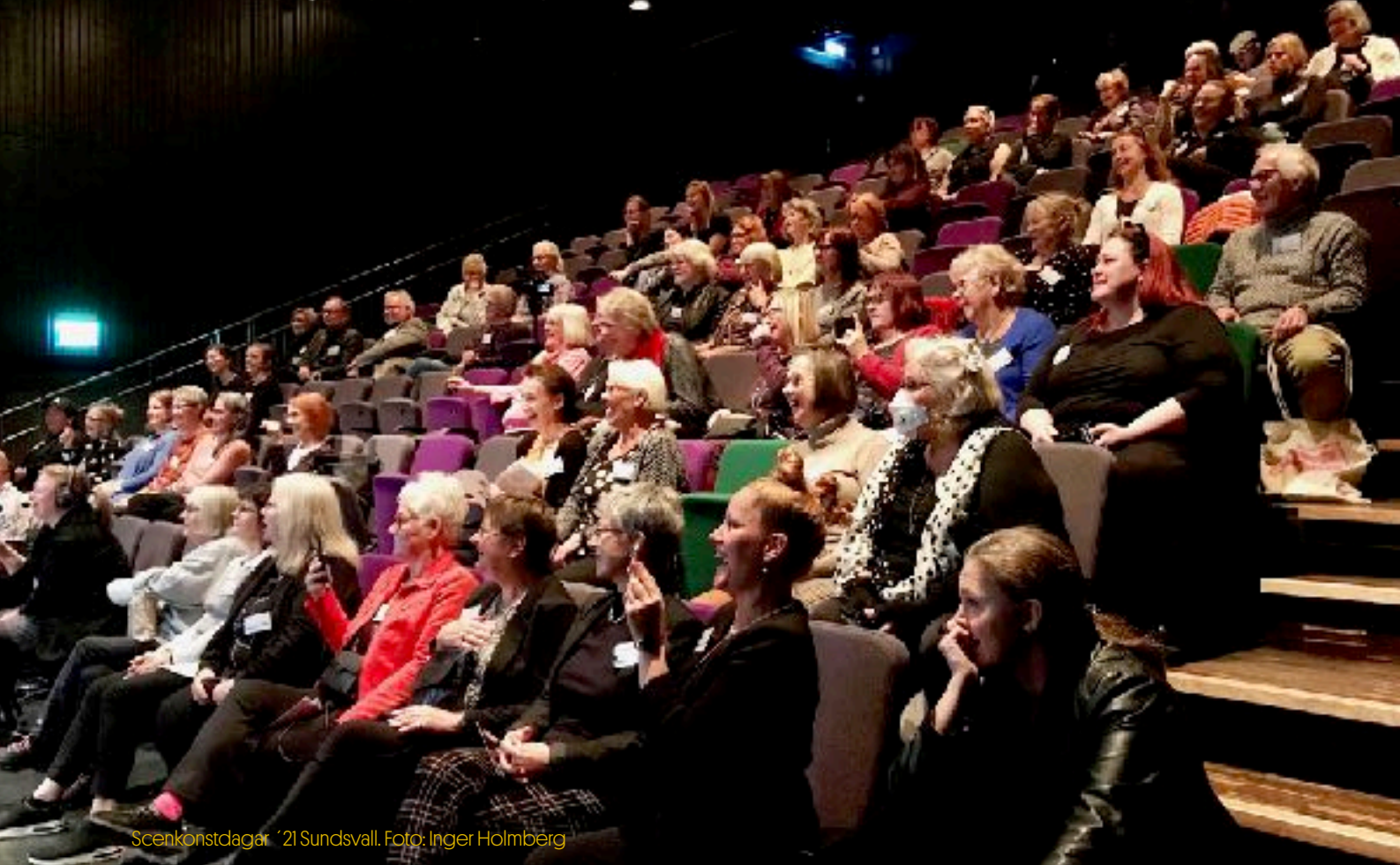
Scenkonstdagar '21 Sundsvall.