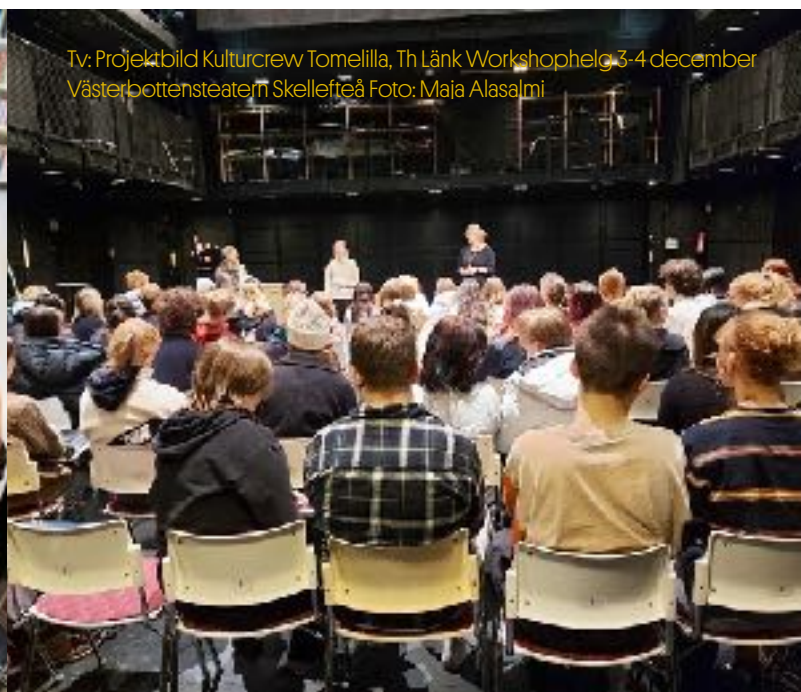
Tv: Projektbild Kulturcrew Tomelilla, Th Länk Workshophelg 3-4 december Västerbottensteatern Skellefteå