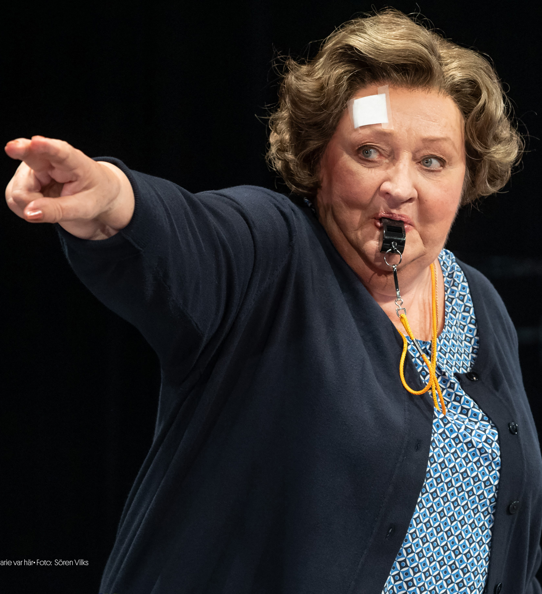
Britt-Marie var här