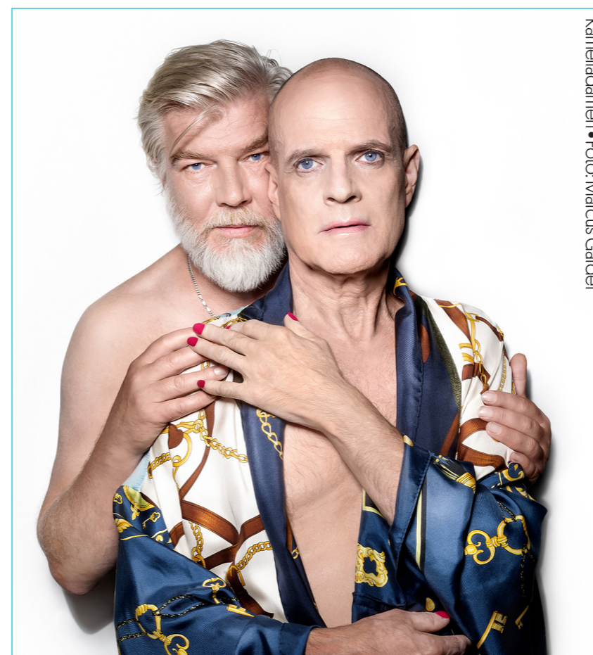
Kameliadamen • Foto: Marcus Gärder

Samverkansarbetet mellan Scen Sundsvall och Scenkonst Västernorrland med ambassadörer på arbetsplatser och i föreningar fortlöper. Syftet är att ombuden ska stimulera och verka för försäljning av biljetter till våra föreställningar på sina arbetsplatser/föreningar samt att sprida information. Bakgrunden har varit ett tidigare samverkansprojekt benämnt Kulturinspiratörerna, vilket vilade under några år och återskapades som ett projekt under 2021. Antalet ambassadörer har ökat under året, vi har nu en grupp med 25 ambassadörer som vi träffar regelbundet. Under 2023 har ambassadörerna aktivt spridit information om föreningens utbud och sålt ett begränsat antal biljetter till Scen Sundsvalls föreställningar.