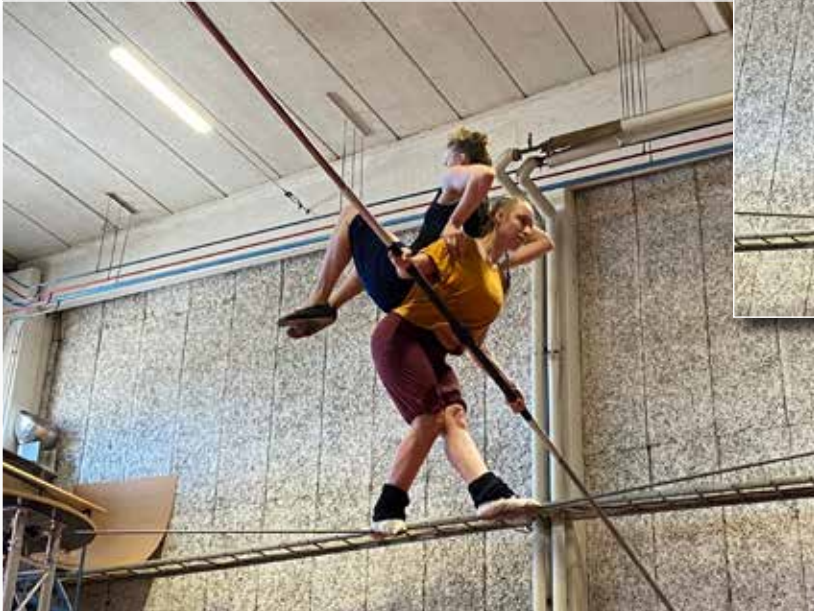
Bilder från deras Work in Progress.