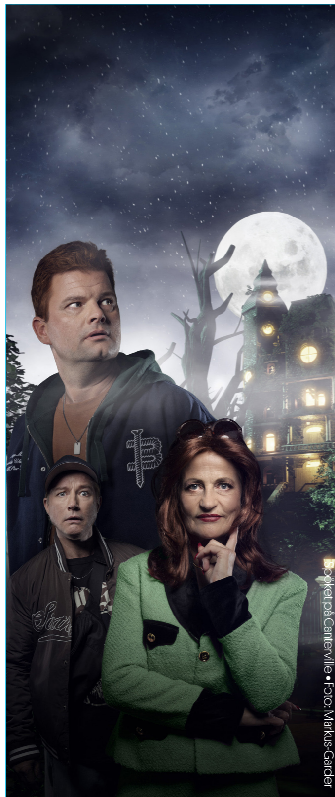
Spöket på Carneville

Genom medlemskapet får våra medlemmar medlemskortet Scenpass Sverige. Kortet ger bland annat reducerat biljettpris på de flesta av Riksteatern Sundsvalls arrangemang. Medlemmarna får också lokala rabatter hos våra partners i Sundsvall – E Street, Café Charm, Herbanist, Sundsvall Chocolate House, IDO te & kafferoasteri och Made in Medelpad. Scenpasset ger dessutom medlemmarna fina rabatter på många evenemang i hela landet.