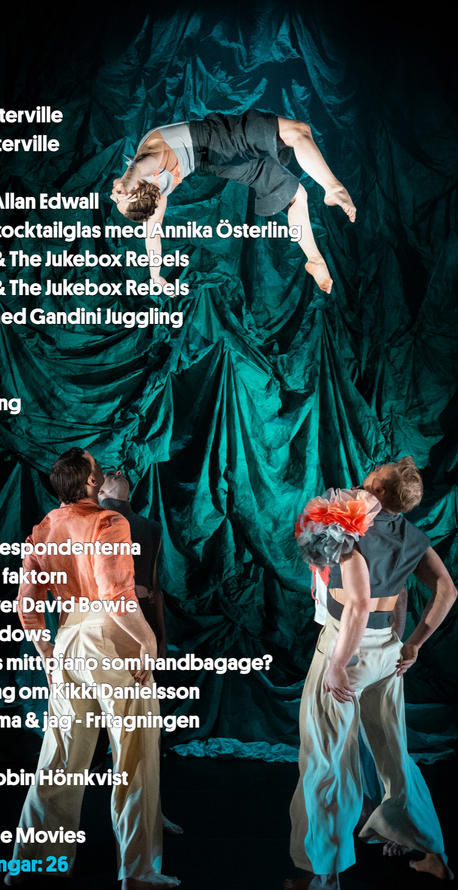
In Praise of Shadows