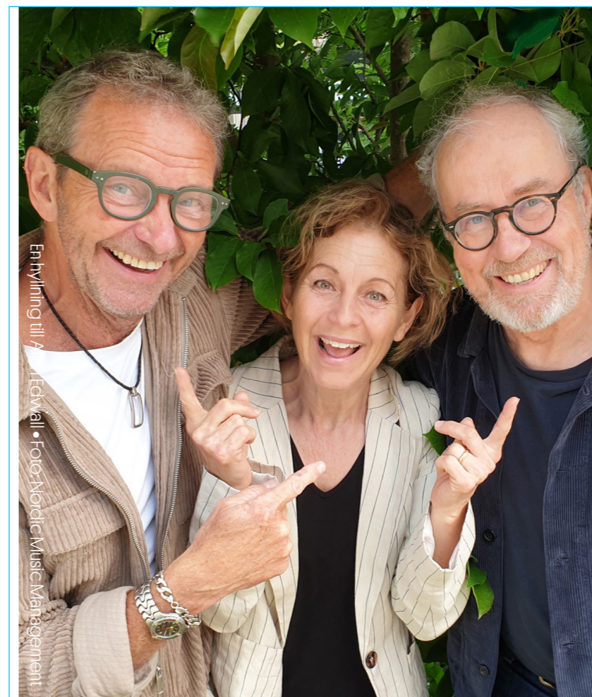
En hyllning till A. Tedqvist

Samverkansarbetet mellan Riksteatern Sundsvall och Scenkonst Västernorrland med ambassadörer på arbetsplatser och i föreningar fortlöper. Syftet är att ombuden ska stimulera och verka för försäljning av biljetter till våra föreställningar på sina arbetsplatser/föreningar samt att sprida information. Ambassadörerna är 20 personer som vi träffar regelbundet. Under 2025 har ambassadörerna aktivt spridit information om föreningens utbud och sålt biljetter till Riksteatern Sundsvalls föreställningar.