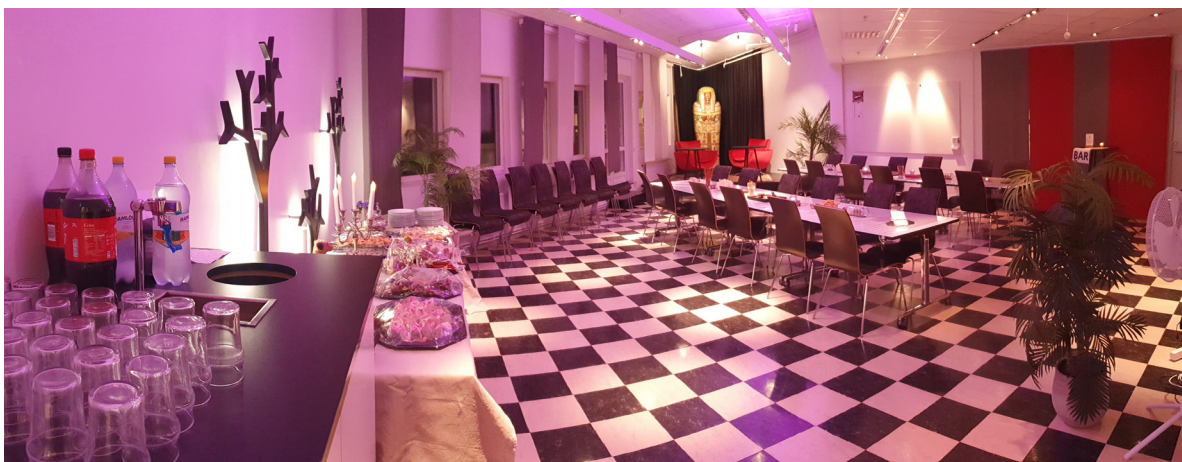
Så här kan ett premiärmingel se ut.

En månad innan föreställningen kommer till dig kommer vår scenmästaren ta kontakt med dig och tala om exakt vilken tid det turnerande teamet är framme, när bygget börjar och när bygg- och bärhjälpen ska vara på plats.